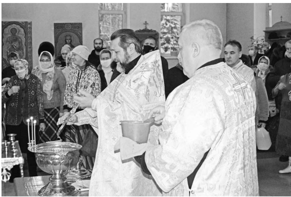
19 января 2021 года, Крещение Господне, храм Космы и Дамиана, п.Думиничи.