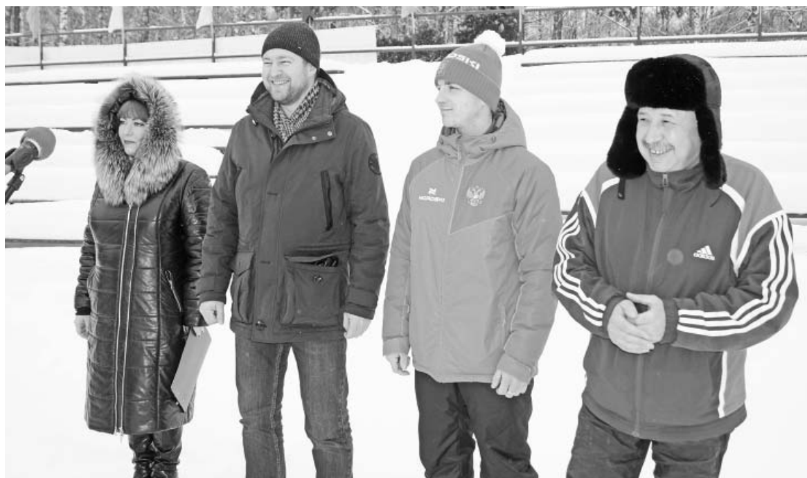
На открытии соревнований.